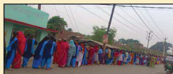
मार्च में महिलाएं, किशोरियों, आशा कार्यकर्ता, आंगनबाड़ी सेविका और शिक्षिकाओं ने लिया भाग