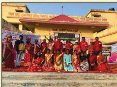
कविता, गायन और अभिनय के माध्यम से महिला हिंसा पर उठाए प्रश्न

खुशियों की उड़ान कार्यक्रम के साथ 16 दिवसीय पखवाड़े का समापन -जेंडर आधारित हिंसा व भेदभाव के खिलाफ -जन-जागरूकता अभियान का हुआ समापन -समापन समारोह के दौरान किशोरियों और किशोरों को अभिव्यक्ति का मिला मंच -कविता, गायन और अभिनय के माध्यम से महिला हिंसा पर उठाए प्रश्न पटना। जेंडर आधारित हिंसा और भेदभाव को समाप्त करने के लिए पूरे विश्व में चलाये जा रहे 16 दिवसीय को बिहार में सहयोगी संस्था द्वारा भी चलाया गया। बीते माह 25 नवंबर से 10 दिसंबर तक चलाये गये जन जागरूकता अभियान चलाया का समापन विश्व मानवाधिकार दिवस के मौके पर मनेर प्रखंड के छोटकी कठौतिया पंचायत सरकार भवन के प्रांगण में "खुशियों की उड़ान" कार्यक्रम आयोजित कर किया गया।