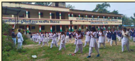
प्रशिक्षण में विद्यालय की 175 छात्राओं ने लिया भाग

स्कूली छात्राओं को आत्म सुरक्षा के लिए सिखाए गए गुर -सहयोगी संस्था के द्वारा राजकीयकृत दुनियारी उच्च माध्यमिक विद्यालय, हथियाकांध में आत्मरक्षा प्रशिक्षण का हुआ आयोजन -प्रशिक्षण में विद्यालय की 175 छात्राओं ने लिया भाग पटना । जेंडर आधारित हिंसा एवं भेदभाव को समाज से समाप्त करने के लिए पूरे विश्व में कई स्वयंसेवी संस्थाओं के द्वारा अलग-अलग तरह की गतिविधियां संचालित की जा रही है। जिसमें किशोर के साथ संवाद,